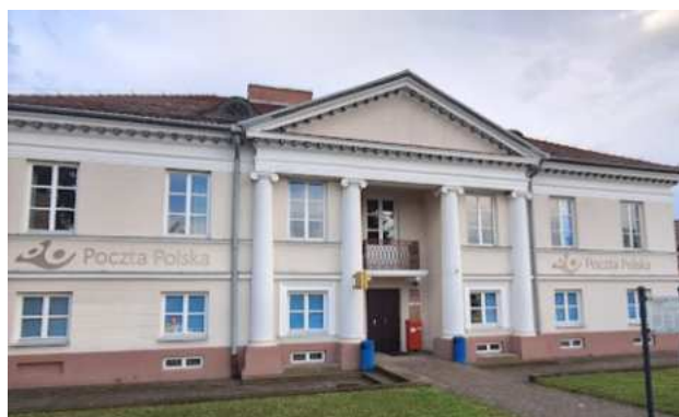
Fotografia 14. Widok na budynek dawnej poczty konnej.

Budynek na rzucie prostokąta, dwukondygnacyjny, pokryty dachem czterospadowym. Budynek tynkowany. Elewacja południowa frontowa siedmioosiowa. W części centralnej trzyosiowy, dwukondygnacyjny portyk joński, zwieńczony trójkątnym szczytem wspartym na kolumnach posadowionych na wysokich, czwrobocznych cokołach.