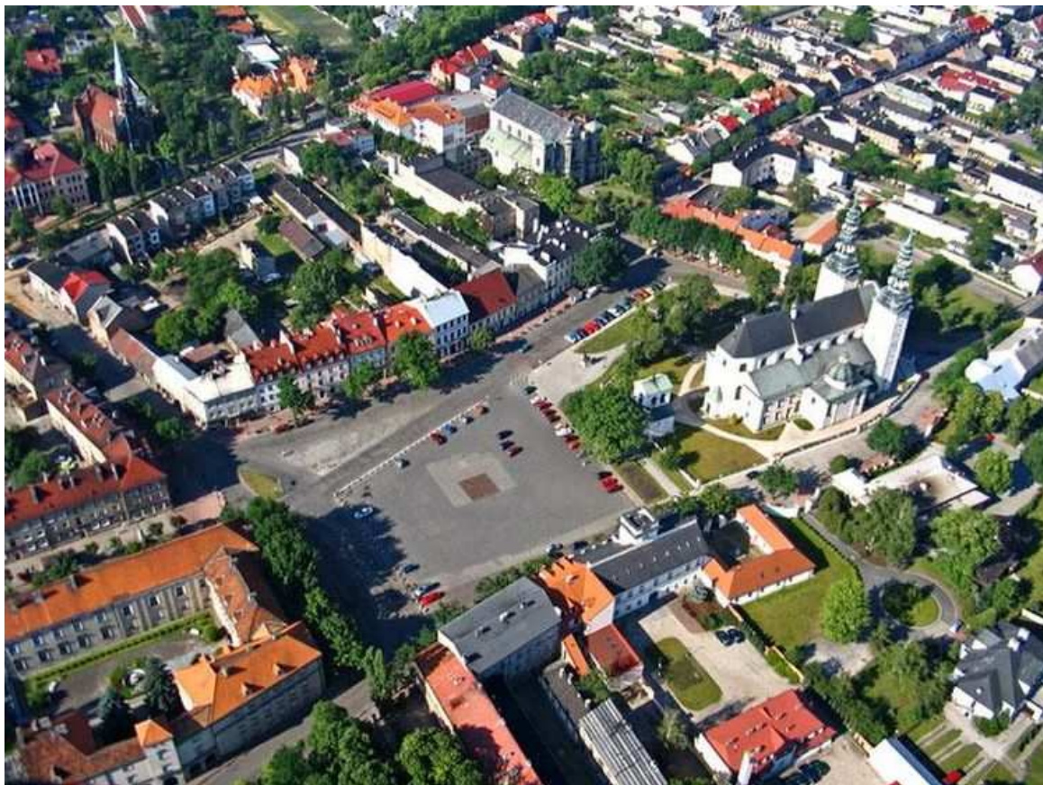
Fotografia 1. Widok na zabudowę Starego Rynku.