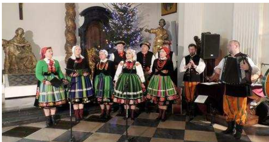
Fotografia 24. Zespół Śpiewaczy „Ksinzoki”.

Zespół Śpiewaczy „Ksinzoki” – powstał w grudniu 2010 r., a jego członkami są twórcy ludowi z Ziemi Łowickiej oraz pasjonaci kultury regionalnej. Zespół wykonuje pieśni księżackie, obrzędowe i religijne, w łowickiej gwarze. W pracy zespołu, ze szczególną uwagą traktuje się autentyczność, zarówno obyczajową, jak i językową.