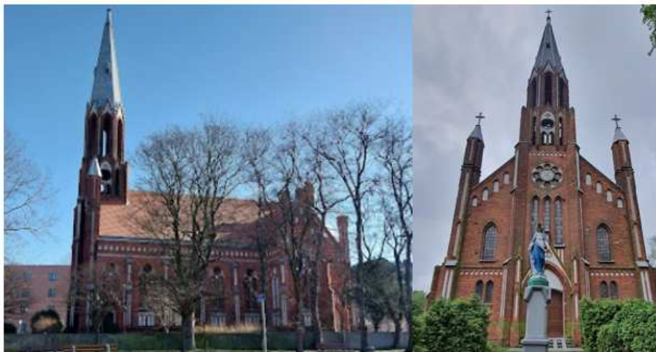
Fotografia 8. Widok na Kościół Starokatolicki Mariawitów p.w. Przenajświętszego Sakramentu elewacja boczna i frontowa.

Dawny Kościół poewangelicki, ul. Podrzeczna 17