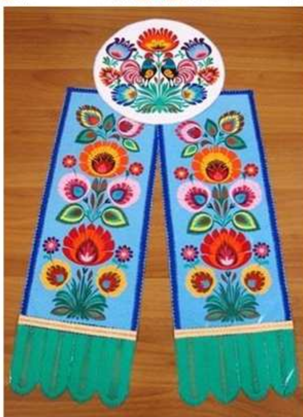
Rysunek 7. Łowickie wycinanki – kody, gwiozdy i tasiemki.

Chlubą regionu jest regionalny strój ludowy. W porównaniu do innych strojów regionalnych, księżacki wyróżnia się bogatszym układem kolorystycznym i malowniczym wykończeniem. Na strój męski składa się filcowany kapelusz z rondem, ozdobiony pasem aksamitu, cekinami, koralikami lub kolorową włóczką. Dalej zakładano lnianą lub bawełnianą białą haftowaną koszulę, kamizelkę, a w zimie dodatkowo kaftan i czasem sukmanę. Zamożniejsi nosili stroje bardziej przyozdobione, kolorowe i bogatsze. Na nogi zakładano buty z wysokimi, karbowanymi przy kostce cholewami lub z cholewami prostymi i sztywnymi. Na strój kobiety składała się kolorowa chusta w kwieciste wzorki noszona na głowie, biała koszula, wielobarwna spódnica o szerokości 5-6 metrów, usztywniające zapaski zakładane na spódnice, szyty zazwyczaj z czarnego aksamitu i zapinany na guziki stanik oraz mały kaftanik zwany spencerkiem. Na nogi zakładano wysokie trzewiki na obcasie sznurowane różnego koloru wełnianymi tasiemkami.