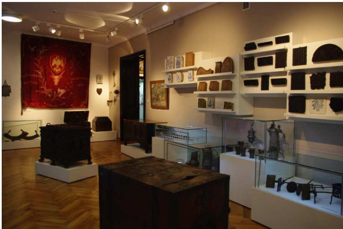
Fotografia 17. Widok na wystawę Historia miasta i regionu.