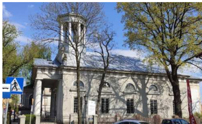
Fotografia 9. Widok na Dawny Kościół poewangelicki.

Dawny Kościół poewangelicki, ul. Podrzeczna 17