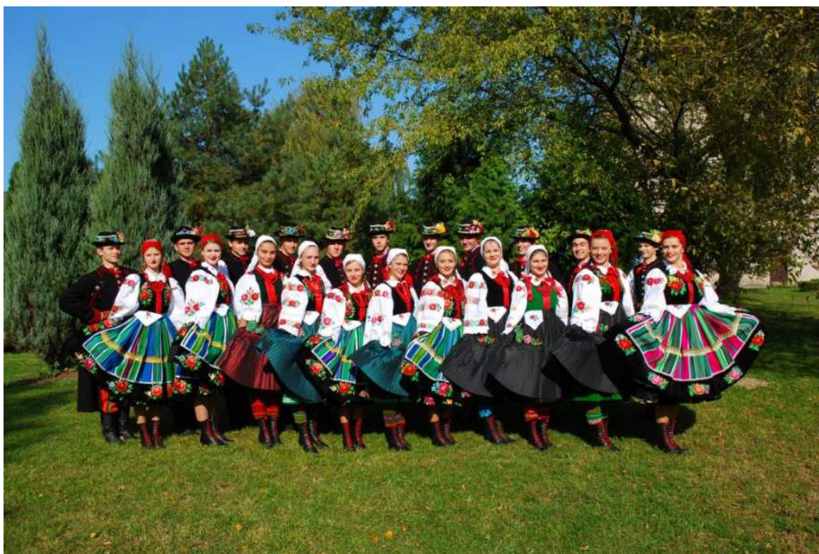
Fotografia 23. Zespół Pieśni i Tańca „Blichowiacy”.

Zespół Śpiewaczy „Ksinzoki” – powstał w grudniu 2010 r., a jego członkami są twórcy ludowi z Ziemi Łowickiej oraz pasjonaci kultury regionalnej. Zespół wykonuje pieśni księżackie, obrzędowe i religijne, w łowickiej gwarze. W pracy zespołu, ze szczególną uwagą traktuje się autentyczność, zarówno obyczajową, jak i językową.