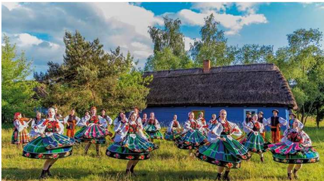
Fotografia 21. Dziecięco – Młodzieżowy Zespół Ludowy „Koderki” (Źródło: http://www.lowiczturystyczny.eu ).

Dziecięco – Młodzieżowy Zespół Ludowy „Koderki” powstał w 1960 r., a nazwę „Koderki” przybrał w 1985 r., która pochodzi od „kody” – prostokątnej, kolorowej, kwiatowej lub tematycznej wycinanki łowickiej. Zespół prezentuje zwyczaje ludowe: „Gaik”, „Chodzenie z kogutkiem” w pięknej i kolorowej oprawie oryginalnych strojów łowickich, a także suity łowickie, krakowskie i śląskie oraz tańce Beskidu Śląskiego.