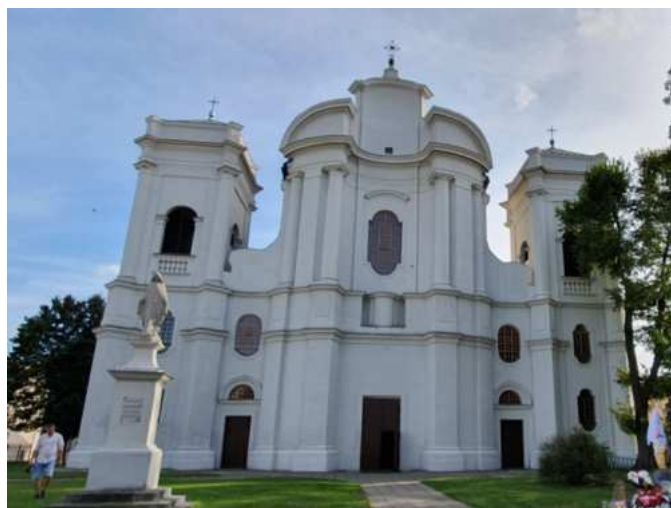
Fotografia 5. Widok na Kościół klasztorny pijarów pw. Najświętszej Marii Panny i św. Wojciecha.

Kościół pijarski jest przykładem obiektu barokowego inspirowanego rodzimą kulturą. Projektantami przebudowy byli architekt Jakub Fontana (wieże) oraz architekt królewski Karol Bay, jeden z najwybitniejszych architektów epoki saskiej (barokowa fasada). Zaliczany jest do najcenniejszych budowli późnobarokowych w Polsce. Posiada charakterystyczną monumentalną, późnobarokową fasadę, zbudowaną na planie falistym. Szczególną wartość ma zachowane w całości XVIII-wieczne wyposażenie kościoła oraz pochodzące z tej samej epoki malowidła w nawach bocznych i prezbiterium. Ołtarz główny z początku XVIII w., zaprojektowany został przez Jakuba Fontanę. Budynek kościoła usytuowany u zbiegu ulic wychodzących ze Starego Rynku, stanowi istotny element zagospodarowania historycznego centrum miasta Łowicza.