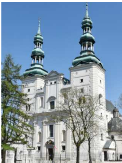
Fotografia 3. Widok na bazylikę katedralną pw. Wniebowzięcia NMP i św. Mikołaja.

Bazylika katedralna p.w. Wniebowzięcia NMP i św. Mikołaja, ul. Stary Rynek 30