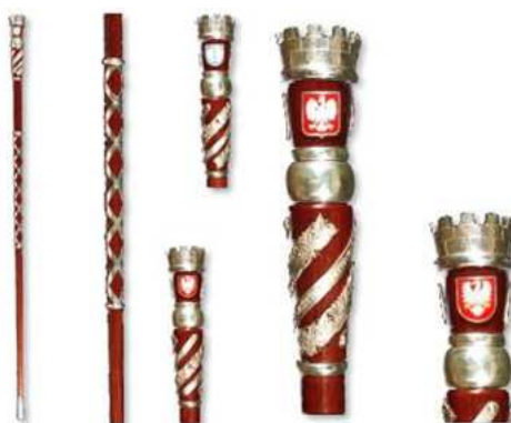
Rysunek 4. Laska Przewodniczącego Rady Miejskiej w Łowiczu.

Laska Przewodniczącego Rady Miejskiej w Łowiczu wykonana jest z toczonego drzewca o długości 165 cm, składa się z głowicy, trzonu i stopki. Głowicę laski w kształcie odwróconego stożka, wykonaną z białego metalu oksydowanego wieńczy stylizowana corona muralis; na górnej powierzchni głowicy widnieje znak Miasta Łowicza, dwa pelikany i drzewo życia między nimi. Na otoku znajduje się napis: Sigillum Civitatis Loviciensis, na bocznej powierzchni stożka umieszczono trzy znaki: herb Rzeczypospolitej Polskiej, herb Miasta Łowicza zwany Herbem Małym i historyczny herb Mazowsza, pokryte emalią o stosownych barwach. Górna część trzonu o długości 15 cm jest kanelowana ze spiralnie owijającą laskę wstęgą z dewizą miasta, a między zwojami wstęgi znajduje się ornament roślinny. Poniżej strefy kanelowanej jest strefa uchwyty ograniczona obręczami z białego metalu. Część trzonu poniżej strefy uchwyty o długości 40 cm zawiera dwie gładkie, spiralnie ułożone wstęgi o przeciwnym kierunku zwojów. Dolna część trzonu długości 75 cm jest gładka zakończona stopką wykonaną z białego metalu, długość stopki to 10 cm.