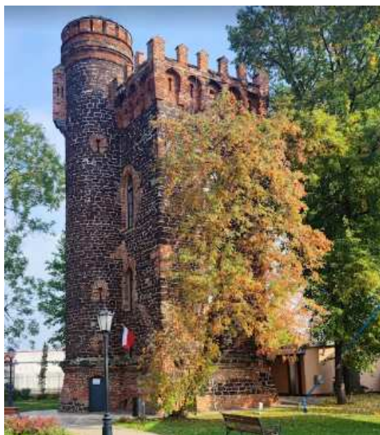
Fotografia 12. Widok na Basztę w Łowiczu.

Baszta, ul. Basztowa 2 (d. ul. 1 Maja 17)