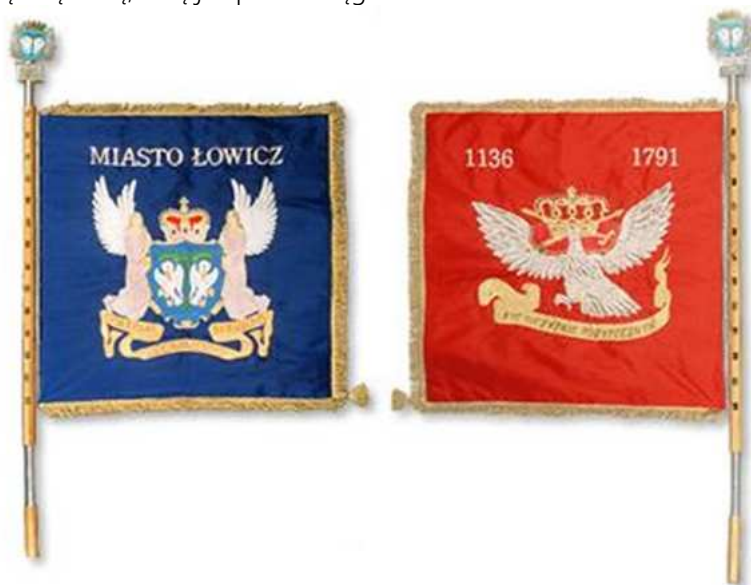
Rysunek 3. Chorągiew Miasta Łowicza.

jest głowica, na dolnym zaś stopka z białego metalu. Na drzewcu umieszczone zostały gwoździe pamiątkowe. Szarfa chorągwi o barwach Rzeczypospolitej zawiązana jest w kokardę umieszczoną poniżej głowicy na drzewcu, po głównej stronie płata. Jej obydwie wolne końce dochodzą do dolnego brzegu płata i obszyte są frędzlą złotą, taką jak płat chorągwi.