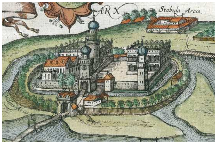
Fotografia 10. Zamek w Łowiczu około 1615 roku.

Ruiny zamku prymasowskiego są świadectwem dawnej świetności Miasta. Zbudowany w XIV w. w rozlewiskach Bzury, początkowo drewniany, a później murowany, swojego czasu stanowił okazałą budowlę, otoczoną rozbudowanymi systemami fortyfikacji, w którym siedzibę mieli kolejni prymasi. Na przestrzeni wieków kolejni rezydenci rozbudowywali go i dokonywali w nim licznych zmian. Okres największego rozkwitu przypada na wiek XVI i pierwszą połowę wieku XVII. Kres świetności przyszedł razem z potopem szwedzkim, kiedy doznał poważnych zniszczeń. Kolejne były następstwem głównie rozbiorów Polski. Jeszcze przed rozbiorami część zamku została przemianowana na fabrykę płótna, a w okresie rozbiorów decyzją rządu pruskiego rozpoczęto jego rozbiórkę. Podczas I wojny światowej służył on jako cmentarz wojskowy. W dwudziestoleciu międzywojennym oraz po II wojnie światowej prowadzono w jego pozostałościach prace archeologiczne.