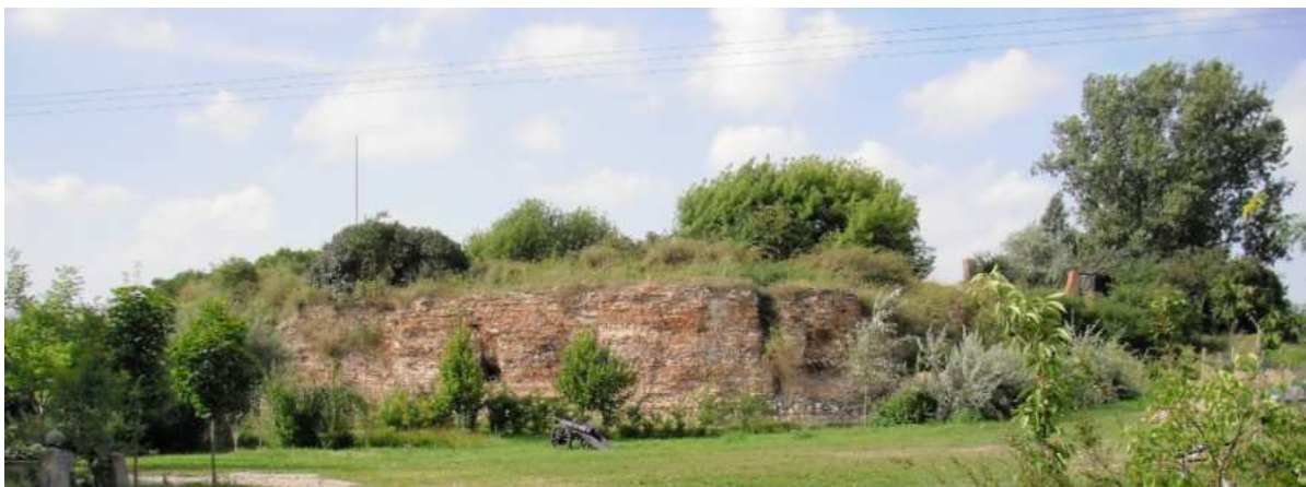
Fotografia 11. Widok na ruiny zamku prymasowskiego obecnie.

Obecnie obszar, gdzie znajdują się ruiny zamku stanowi własność prywatną, ale jest udostępniany zwiedzającym.