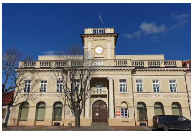
Fotografia 13. Widok na Urząd Miejski w Łowiczu.