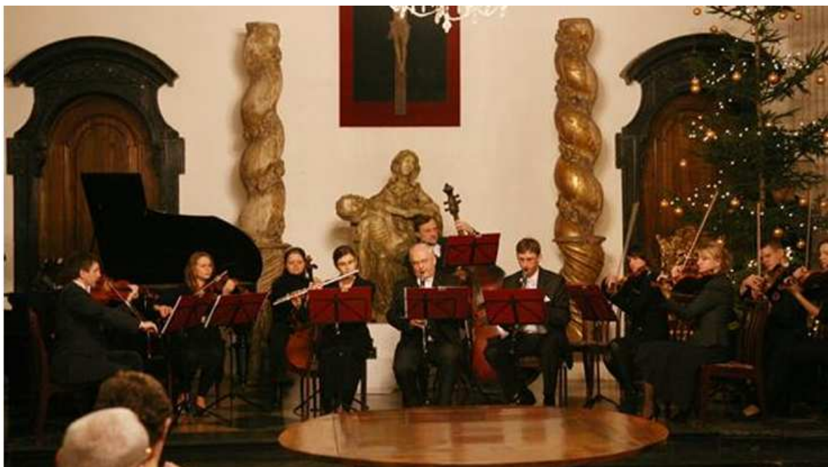
Fotografia 22. Łowicka Orkiestra Kameralna.

Łowicka Orkiestra Kameralna powstała w 2001 r., a jej ideą była chęć wspólnego muzykowania oraz inne spojrzenie na kulturę muzyczną Łowicza.