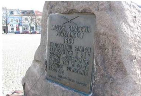
Fotografia 2. Widok na zabudowę Nowego Rynku.