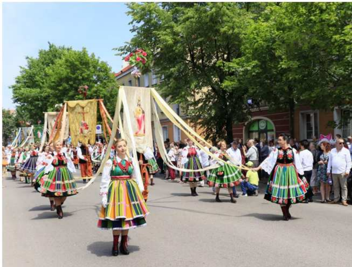
Fotografia 20. Procesja Bożego Ciała w Łowiczu.

prowadzi ulicami Łowicza, wyruszając spod Bazyliki Katedralnej do czterech ołtarzy, przy których wierni zatrzymują się, by wysłuchać Słowa Bożego w kilku językach. W procesji uczestniczą przedstawiciele lokalnych władz samorządowych, liczni goście i turyści.