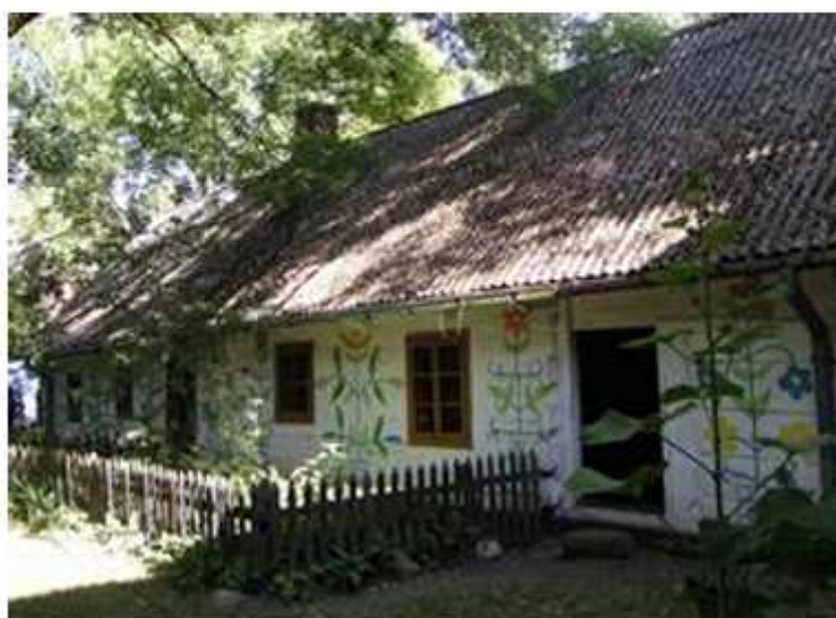
Fotografia 18. Skansen przy Muzeum w Łowiczu.

Poza skansenem w Łowiczu, funkcjonuje Łowicki Park Etnograficzny w Maurzycach, w ramach którego zgromadzono zabytki architektury z terenu dawnego Księstwa Łowickiego (obszar współczesnych powiatów łowickiego i skierniewickiego). Skansen położony jest w odległości ok. 7 km od Łowicza, przy trasie Warszawa – Poznań. Obecnie znajduje się tu ponad 40 obiektów, datowanych w większości