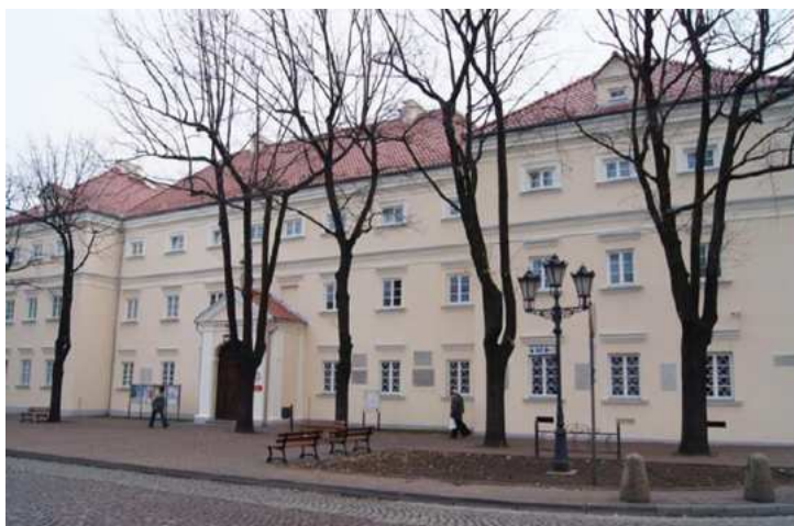
Fotografia 4. Widok na Gmach pomisjonarski.

są obecnie siedzibą Muzeum w Łowiczu. Przy Muzeum można zwiedzić skansen, w którym prezentowane są zabudowania łowickie z połowy XVIII i XIX wieku.