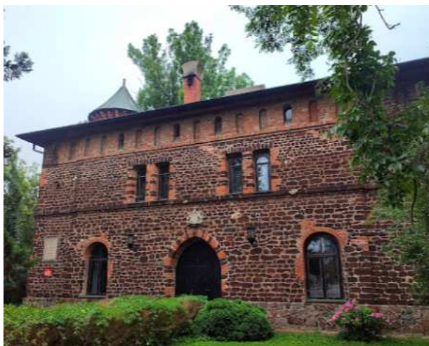
Fotografia 16. Widok na Pałac Klickiego (Źródło: https://www.google.pl/maps/ ).

Pałac to obiekt historyczny znajdujący się w Łowiczu, który został wybudowany w latach 1822–1824 wg projektu Karola Krauze. Stanowi on część większego zespołu pałacowego, w którego skład wchodzi również kaplica, wieża obronna i dom dozorczy. Cały kompleks zaprojektowano w stylu romantycznym, a otacza go park w stylu angielskim.