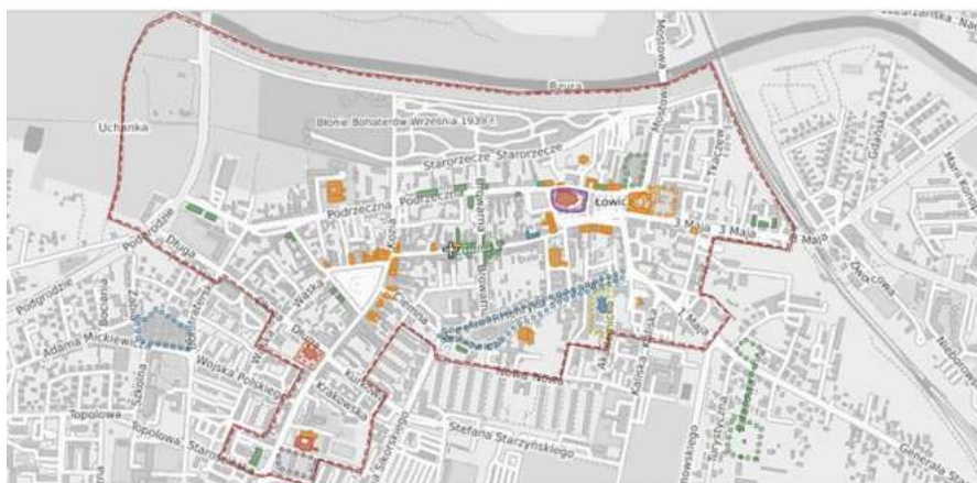
Rysunek 6. Strefa ścisłej ochrony konserwatorskiej.

Strefa ochrony konserwatorskiej obejmuje swym zasięgiem historyczny układ urbanistyczny Łowicza, w tym Stare Miasto, Nowe Miasto, dawny gród i Podgórze, przedmieście Tkaczew. Okres kształtowania układu przestrzennego w ramach strefy obejmuje XIII-XVIII w. W zasięgu strefy położona jest większość najważniejszych zabytków Miasta, wśród nich m.in. ruiny zamku, ratusz miejski, bazylika katedralna, zabudowania prymasowskie, gmach pomisjonarski z barokową kaplicą Boromeusza oraz niezwykle urokliwa mieszczańska zabudowa.