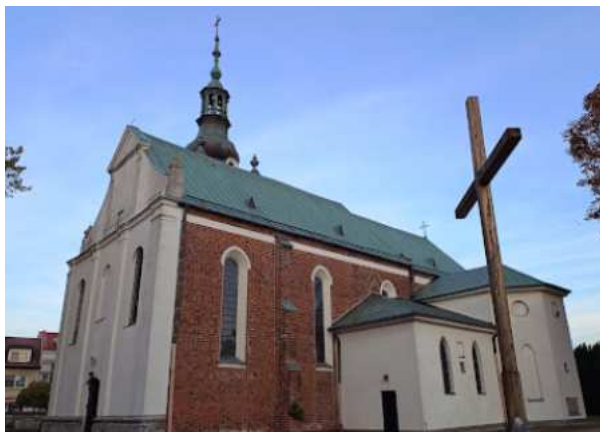
Fotografia 7. Widok na Kościół parafialny pw. Świętego Ducha.

Kościół parafialny pw. Świętego Ducha ul. Długa 1