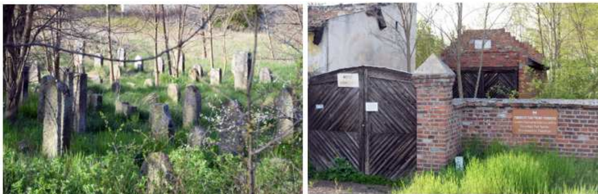
Fotografia 15. Widok na cmentarz żydowski oraz bramę wejściową cmentarza.

Cmentarz zajmuje działkę w kształcie nieregularnego wieloboku o powierzchni 1,8631 ha. Granice wyznacza ogrodzenie, w części południowej i wschodniej historyczne, ceglane, zaś w pozostałej partii współczesne, z płyt betonowych. Liczbę zachowanych pochówków określa się przybliżeniu na ok. 400. Są to nagrobki o różnej formie; steli, płyt nagrobnych, pomników otoczonych metalowym ogrodzeniem, obelisków. Najstarszy zachowany nagrobek pochodzi z 1831 r. Nie przetrwał pierwotny układ cmentarza, zatarte są ciągi komunikacyjne oraz podział na kwatery. Południowa część terenu jest zadrzewiona.