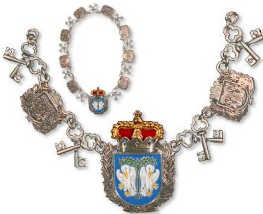
Rysunek 5. Łańcuch Burmistrza Miasta Łowicza.