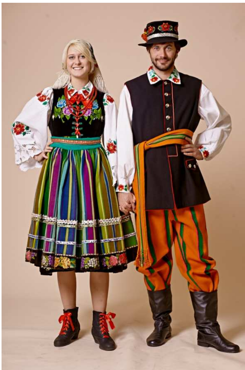
Fotografia 19. Strój łowicki.