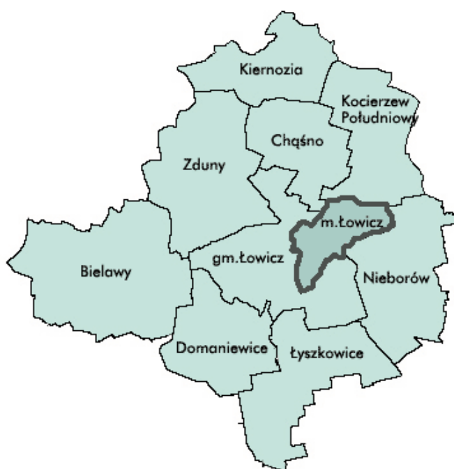
Rysunek 1. Położenie miasta Łowicza na tle powiatu łowickiego.

Miasto Łowicz położone jest w centralnej Polsce w północno - wschodniej części województwa łódzkiego, w centralnej części powiatu łowickiego, którego jest stolicą. Jest to powiat ziemski obejmujący 9 gmin wiejskich: Chąsno i Kocierzew Południowy, z którymi miasto graniczy od północy, Łowicz - od południa i zachodu, Nieborów - od wschodu, oraz gminy Łyszkowice, Zduny, Bielawy, Domaniewice, Kiernozia.