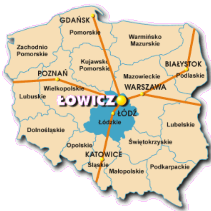
Rysunek 2. Położenie miasta Łowicza na tle województwa łódzkiego i Polski.

Gmina charakteryzuje się dużym potencjałem inwestycyjnym z racji lokalizacji i dostępności komunikacyjnej. Miasto położone jest w rejonie skrzyżowania głównych dróg i autostrad – w odległości 12 km od węzłów komunikacyjnych autostrady A - 2 (Berlin - Moskwa) w miejscowościach Nieborów i Łyszkowice, 35 km do skrzyżowania autostrady A-1 (północ - południe) z autostradą A-2 w Strykowie. Przez teren miasta przebiegają trzy drogi krajowe - Nr 2 relacji Warszawa - Poznań, która pełni ważną rolę w relacjach międzynarodowych, Nr 14 relacji Łowicz – Łódź oraz Nr 70 relacji Łowicz - Skierniewice. Od międzynarodowego lotniska Warszawa – Okęcie miasto dzieli 80 km (1,5 godziny jazdy samochodem), a od lotniska międzynarodowego Łódź - Lublinek – 50 km (50 minut jazdy samochodem).