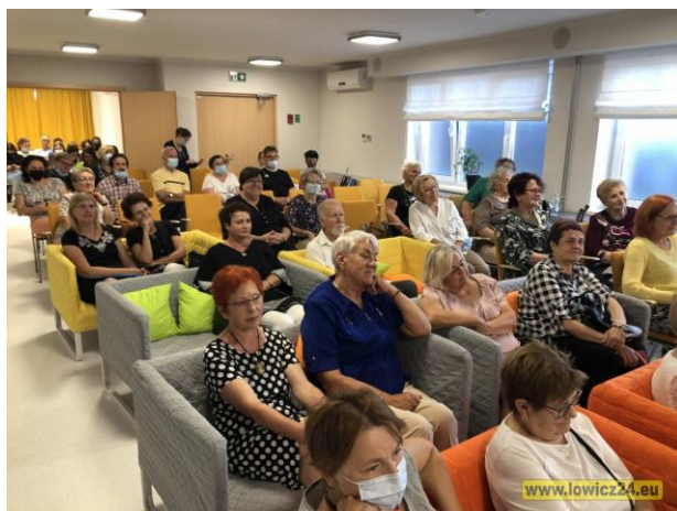
Fot. 1. Mała sala konferencyjna w Miejskiej Bibliotece im. A.K. Cebrowskiego w Łowiczu. Fot. 2. Duża sala konferencyjna.

Od sierpnia 2020 roku duża liczba organizacji pozarządowych pozyskała swoje siedziby w budynku Urzędu Miejskiego w Łowiczu (dawne Gimnazjum nr 1), mieszczącym się przy Al. Sienkiewicza 62. Jest to siedziba Wydziału Współpracy z Organizacjami Pozarządowymi, Aktywności Obywatelskiej i Przedsiębiorczości. Umowy na najem lokali zostały podpisane na preferencyjnych warunkach (2 zł/m 2 czynszu) na okres 3 lat z następującymi organizacjami i podmiotami pokrewnymi, które mają w tym miejscu swoje siedziby i prowadzą tu bogatą działalność statutową: