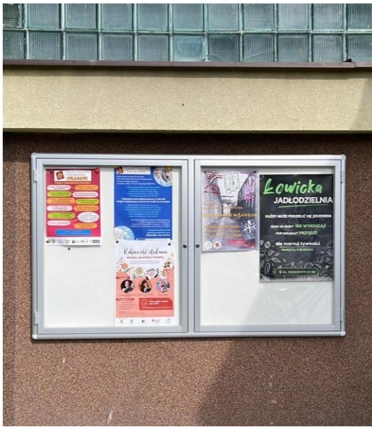
Fot. 4. Tablica ogłoszeniowa zewnętrzna dla NGO.

Łowickie stowarzyszenia mają możliwość korzystania z nośników reklamy w budynku Urzędu Miejskiego przy Al. Sienkiewicza 62, tj. telewizora w korytarzu głównym, tablic magnetycznych, mniejszych i dużych tablic - „potykaczy”, a także ekspozytora do ulotek i prospektów.