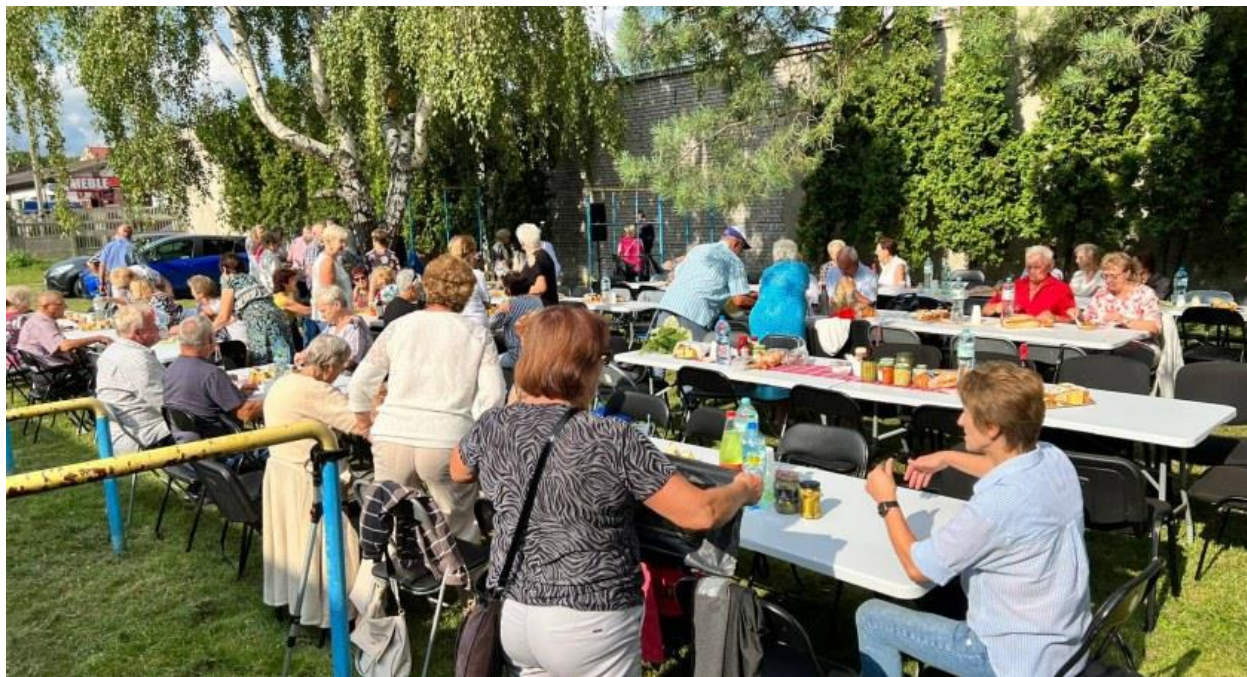
Fot. 3. Piknik Polskiego Związku Emerytów i Rencistów oddział Łowicz.

Coraz bardziej dla NGO atrakcyjna jest przestrzeń sąsiadująca z budynkiem w Al. Sienkiewicza 62. Systematycznemu rozwojowi ulegają tu tereny zielone - tworzone są trawniki, sadzone drzewa i krzewy, pojawiają ławki i stojaki rowerowe. „Dziedziniec” obiektu chętnie wykorzystywany jest, jako miejsce organizacji pikników: Klubu Seniora „Radość”, Polskiego Związku Emerytów i Rencistów, Koła Diabetyków. Prowadzone są tu również zajęcia sportowe.