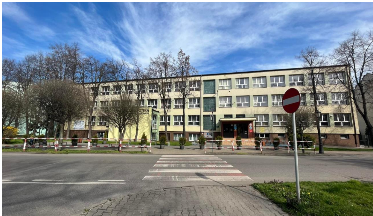
Fot. 2. „Budynek stowarzyszeniowy” – Al. Sienkiewicza 62.

Coraz bardziej dla NGO atrakcyjna jest przestrzeń sąsiadująca z budynkiem w Al. Sienkiewicza 62. Systematycznemu rozwojowi ulegają tu tereny zielone - tworzone są trawniki, sadzone drzewa i krzewy, pojawiają ławki i stojaki rowerowe. „Dziedziniec” obiektu chętnie wykorzystywany jest, jako miejsce organizacji pikników: Klubu Seniora „Radość”, Polskiego Związku Emerytów i Rencistów, Koła Diabetyków. Prowadzone są tu również zajęcia sportowe.