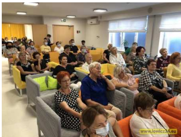
Fot. 1. Mała sala konferencyjna w Miejskiej Bibliotece im. A.K. Cebrowskiego w Łowiczu. Fot. 2. Duża sala konferencyjna.

Od sierpnia 2020 roku duża liczba organizacji pozarządowych pozyskała swoje siedziby w budynku Urzędu Miejskiego w Łowiczu (dawne Gimnazjum nr 1), mieszczącym się przy Al. Sienkiewicza 62. Jest to siedziba Wydziału Współpracy z Organizacjami Pozarządowymi, Aktywności Obywatelskiej i Przedsiębiorczości. Umowy na najem lokali zostały podpisane na preferencyjnych warunkach (2 zł/m 2 czynszu) na okres 3 lat z następującymi organizacjami i podmiotami pokrewnymi, które mają w tym miejscu swoje siedziby i prowadzą tu bogatą działalność statutową: