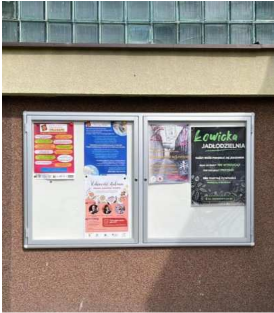
Fot. 4. Tablica ogłoszeniowa zewnętrzna dla NGO.

Łowickie stowarzyszenia mają możliwość korzystania z nośników reklamy w budynku Urzędu Miejskiego przy Al. Sienkiewicza 62, tj. telewizora w korytarzu głównym, tablic magnetycznych, mniejszych i dużych tablic - „potykaczy”, a także ekspozytora do ulotek i prospektów.