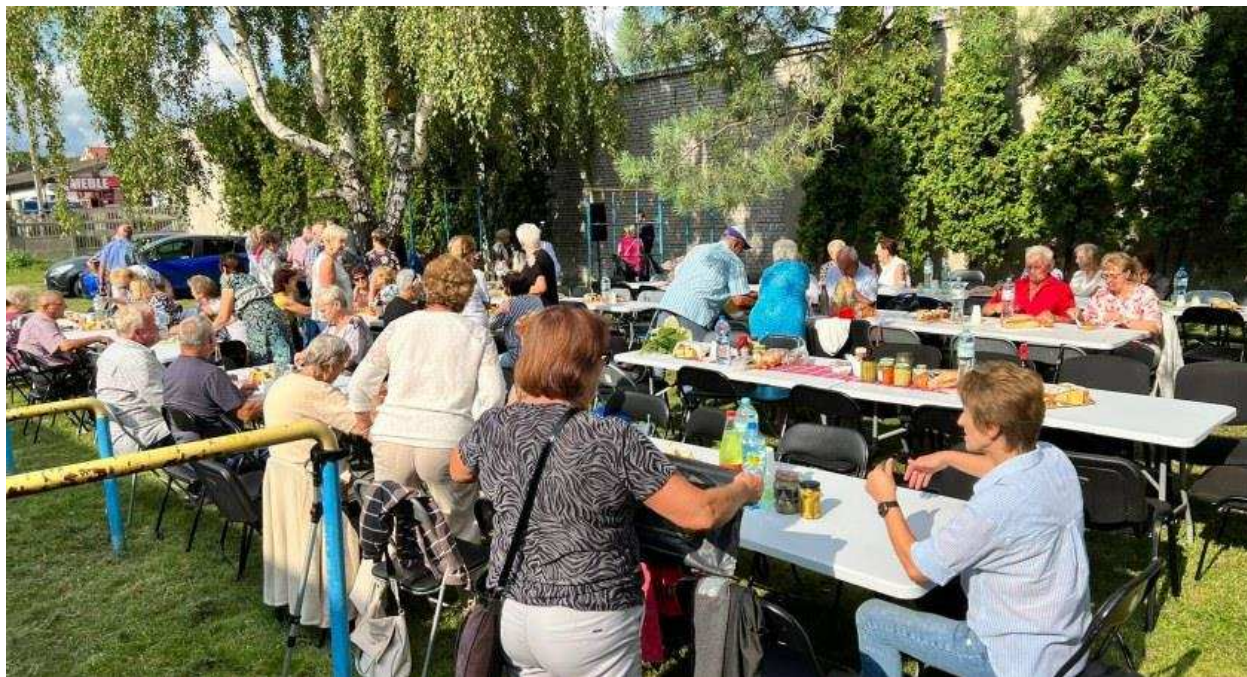
Fot. 3. Piknik Polskiego Związku Emerytów i Rencistów oddział Łowicz.

Coraz bardziej dla NGO atrakcyjna jest przestrzeń sąsiadująca z budynkiem w Al. Sienkiewicza 62. Systematycznemu rozwojowi ulegają tu tereny zielone - tworzone są trawniki, sadzone drzewa i krzewy, pojawiają ławki i stojaki rowerowe. „Dziedziniec” obiektu chętnie wykorzystywany jest, jako miejsce organizacji pikników: Klubu Seniora „Radość”, Polskiego Związku Emerytów i Rencistów, Koła Diabetyków. Prowadzone są tu również zajęcia sportowe.