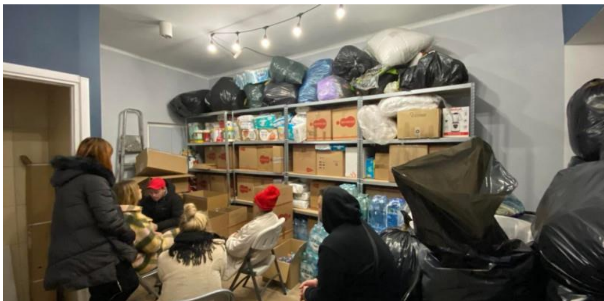
Fot. 7. Pierwszy magazyn pomocowy dla Ukrainy w siedzibie stowarzyszenia łączy nas Łowicz, fot. lowicz24.eu.

Stowarzyszenia organizowały transporty na granicę, szukały miejsc noclegowych, wspierały utworzone później ośrodki noclegowe przy ul. Kaliskiej, Jana Pawła II, Warszawskiej. Do działań włączyła się licznie społeczność Łowicza dając wspierać przykład solidarności i ofiarności.