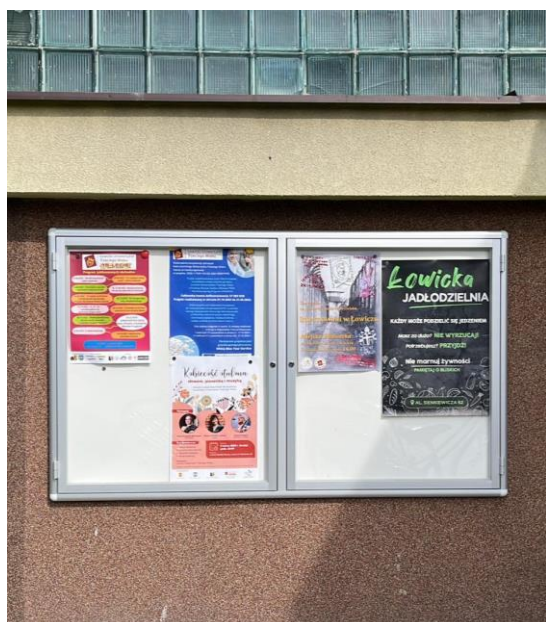
Fot. 5. Tablica ogłoszeniowa zewnętrzna dla NGO.

Łowickie stowarzyszenia mają możliwość korzystania z nośników reklamy w budynku Urzędu Miejskiego przy Al. Sienkiewicza 62, tj. telewizora w korytarzu głównym, tablic magnetycznych, mniejszych i dużych tablic - „potykaczy”, a także ekspozytora do ulotek i prospektów.