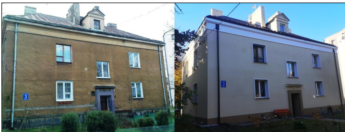
Budynek Wspólnoty Mieszkaniowej Kostka 3 w Łowiczu (przed i po termomodernizacji)