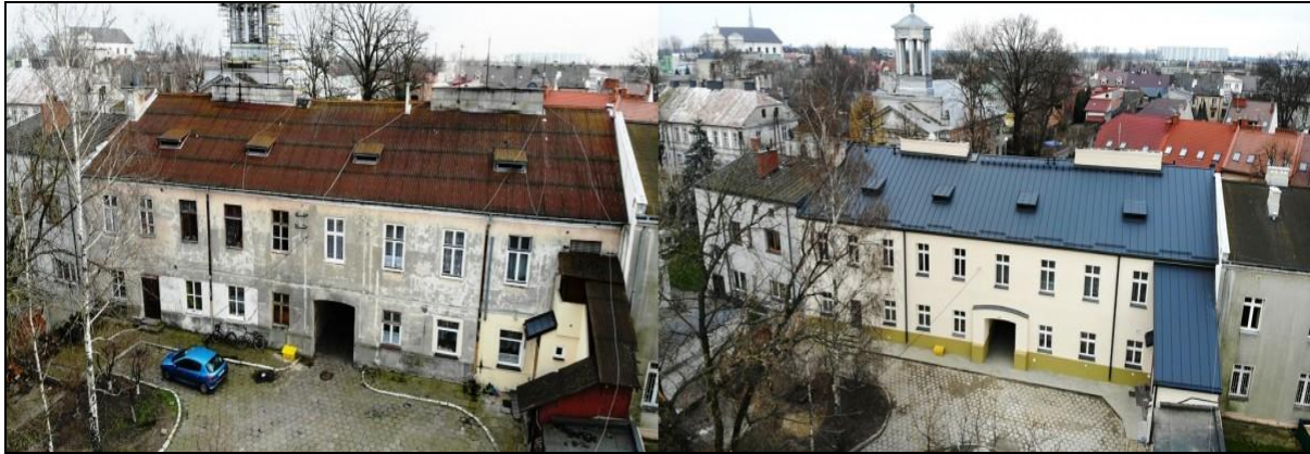
Budynek mieszkalny, wielorodzinny przy ul. Podrzecznej 18 w Łowiczu – tyl (przed i po termomodernizacji)