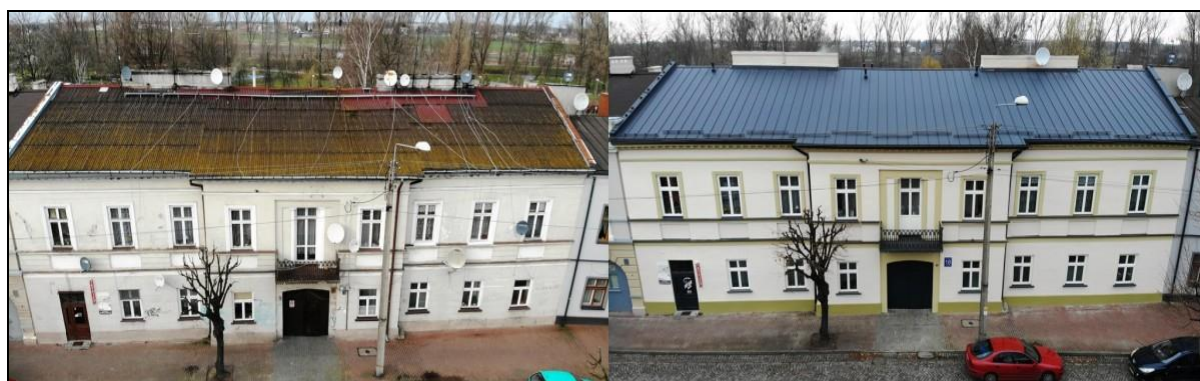
Budynek mieszkalny, wielorodzinny przy ul. Podrzecznej 18 w Łowiczu – front (przed i po termomodernizacji)