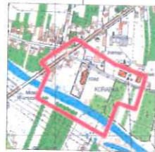
MAPA DO CELÓW PROJEKTOWYCH w skali 1:500

BIUROWA GOSPODARSTWA "GEO-INT" Michał Kozłowski 35-102 Łowicz, ul. Koszalińska 7 tel. 41 752 036 428 www.gio.pl; www.geoint.pl