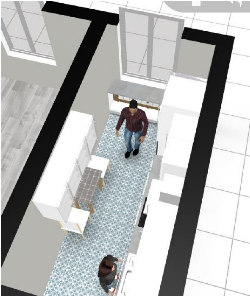
Zabudowa grzejnika pod oknem szafki otwarte wraz z blatem który połączony jest z parapetem