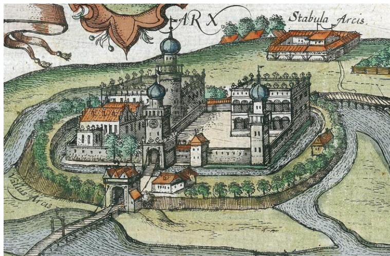
Fotografia 10. Zamek w Łowiczu około 1615 roku.

Obecnie obszar, gdzie znajdują się ruiny zamku stanowi własność prywatną, ale jest udostępniany zwiedzającym.