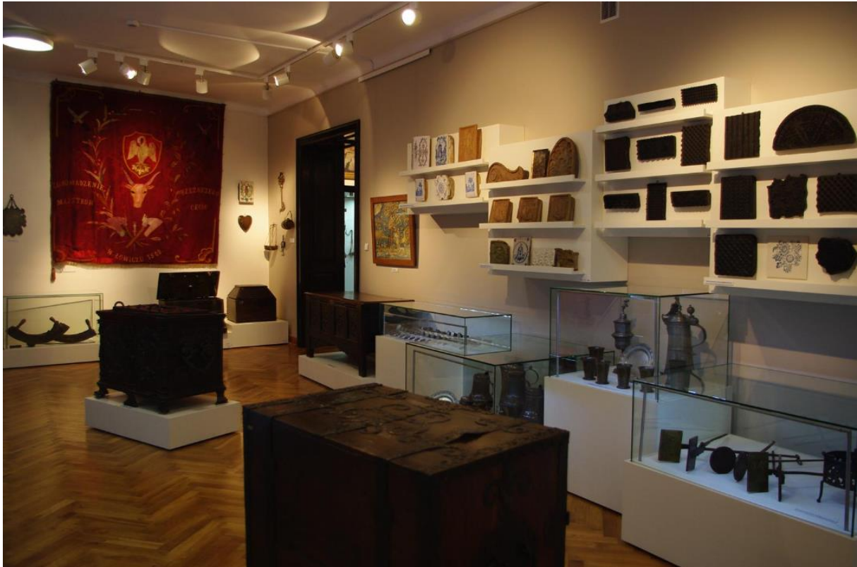
Fotografia 17. Widok na wystawę Historia miasta i regionu.

Muzeum organizuje również wystawy czasowe. Historia i kultura łowicka prezentowana jest również na wystawach w innych instytucjach.