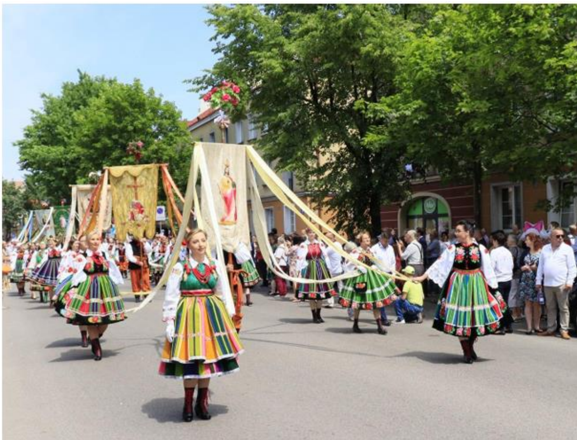
Fotografia 20. Procesja Bożego Ciała w Łowiczu.

Procesja Bożego Ciała w Łowiczu jest symbolem regionu łowickiego i jedną z najpiękniejszych oraz najbardziej rozpoznawalnych w całym kraju. Mieszkańcy Miasta i jego okolic ubierają wówczas wielobarwne i unikalne stroje ludowe, dzięki czemu wydarzenie to zachwyca wyjątkowym klimatem. Procesję wzbogacają niesione chorągwie, sztandary i feretorny. Trasa procesji prowadzi ulicami Łowicza, wyruszając spod Bazyliki Katedralnej do czterech ołtarzy, przy których wierni zatrzymują się, by wysłuchać Słowa Bożego w kilku językach. W procesji uczestniczą przedstawiciele lokalnych władz samorządowych, liczni goście i turyści.