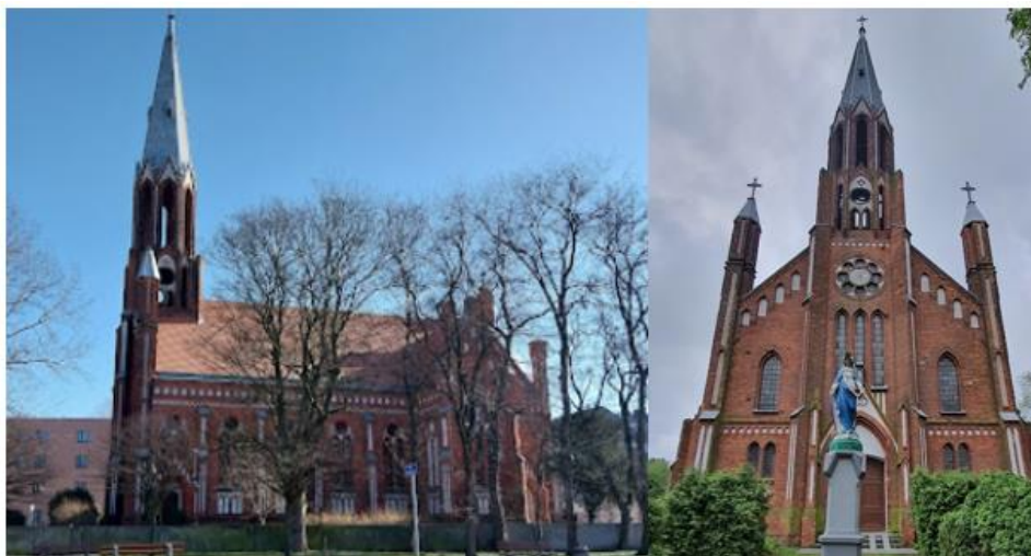
Fotografia 8. Widok na Kościół Starokatolicki Mariawitów p.w. Przenajświętszego Sakramentu elewacja boczna i frontowa.

Budowla w stylu neogotyckim, typu bazylikowego, powstała na planie krzyża łacińskiego. Nawa główna o sklepieniu kolebkowo-krzyżowym jest znacznie wyższa niż boczne, wsparte na 8 kolumnach. Wyposażenie kościoła jest bardzo skromne. W ołtarzu głównym znajduje się Chrystus Ukrzyżowany, na prawo od ołtarza obraz Matki Boskiej Nieustającej Pomocy, po stronie lewej – ambona metalowa, koszowa z 1910. Na antepedium ołtarza (jedyne w kościele) widnieje herb Łowicza. Przed kościołem znajduje się statua Maryi Panny, stanowiąca pamiątkę konsekracji biskupiej w 1910.