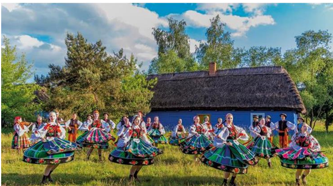
Fotografia 21. Dziecięco – Młodzieżowy Zespół Ludowy „Koderki”.

Dziecięco – Młodzieżowy Zespół Ludowy „Koderki” powstał w 1960 r., a nazwę „Koderki” przybrał w 1985 r., która pochodzi od „kody” – prostokątnej, kolorowej, kwiatowej lub tematycznej wycinanki łowickiej. Zespół prezentuje zwyczaje ludowe: „Gaik”, „Chodzenie z kogutkiem” w pięknej i kolorowej oprawie oryginalnych strojów łowickich, a także suity łowickie, krakowskiej śląskie oraz tańce Beskidu Śląskiego.