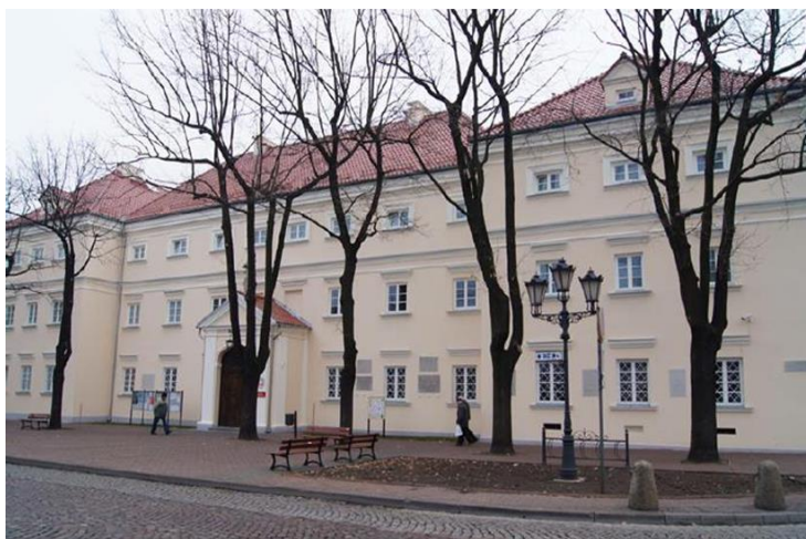
Fotografia 4. Widok na Gmach pomisjonarski.

Gmach zbudowano w stylu barokowym pod koniec XVII w. wg projektu Tylmana z Gameren. Budynek powstał z fundacji prymasa Polski Michała Radziejowskiego. Obiekt kryje w swoich wnętrzach kaplicę św. Karola Boromeusza – jeden z najcenniejszych zabytków baroku w Polsce. Wnętrze kaplicy zdobią freski z przełomu XVII i XVIII w., autorstwa Michała Anioła Palloniego. Dawne zabudowania seminarium są obecnie siedzibą Muzeum w Łowiczu. Przy Muzeum można zwiedzić skansen, w którym prezentowane są zabudowania łowickie z połowy XVIII i XIX wieku.