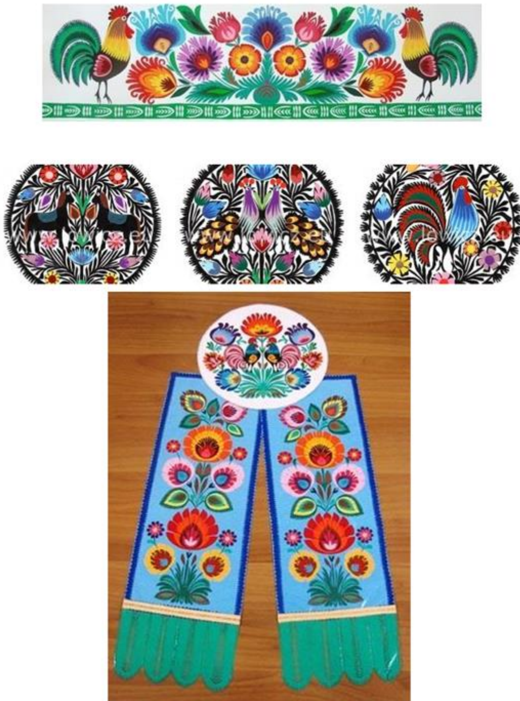
Rysunek 7. Łódzkie wycinanki – kodry, gwiozdy i tasiemki.

Chlubą regionu jest regionalny strój ludowy. W porównaniu do innych strojów regionalnych, księżacki wyróżnia się bogatszym układem kolorystycznym i malowniczym wykończeniem. Na strój męski składa się filcowany kapelusz z rondem, ozdobiony pasem aksamitu, cekinami, koralikami lub kolorową włóczką. Dalej zakładano lnianą lub bawełnianą białą haftowaną koszulę, kamizelkę, a w zimie dodatkowo kaftan i czasem sukmanę. Zamożniejsi nosili stroje bardziej przyozdobione, kolorowe i bogatsze. Na nogi zakładano buty z wysokimi, karbowanymi przy kostce cholewami lub z cholewami prostymi i sztywnymi. Na strój kobiety składała się kolorowa chusta w kwieciste wzorki noszona na głowie, biała koszula, wielobarwna spódnica o szerokości 5-6 metrów, usztywniające