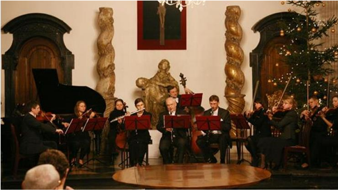
Fotografia 22. Łowicka Orkiestra Kameralna.

Pozostałymi zespołami ludowymi reprezentującymi i promującymi Miasto są: