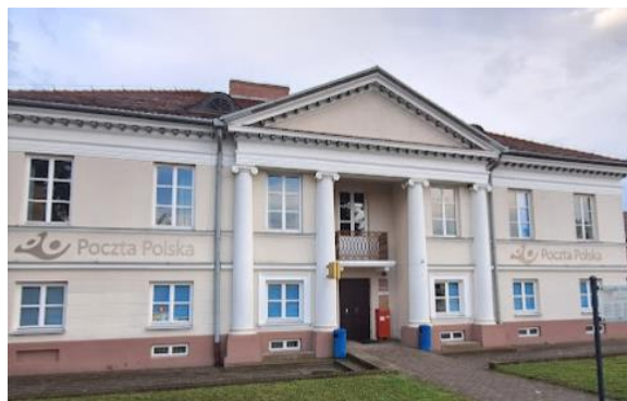
Fotografia 14. Widok na budynek dawnej poczty konnej.

Budynek na rzucie prostokąta, dwukondygnacyjny, pokryty dachem czterospadowym. Budynek tynkowany. Elewacja południowa frontowa siedmioosiowa. W części centralnej trzyosiowy, dwukondygnacyjny portyk joński, zwieńczony trójkątnym szczytem wspartym na kolumnach posadowionych na wysokich, czwrobocznych cokołach.