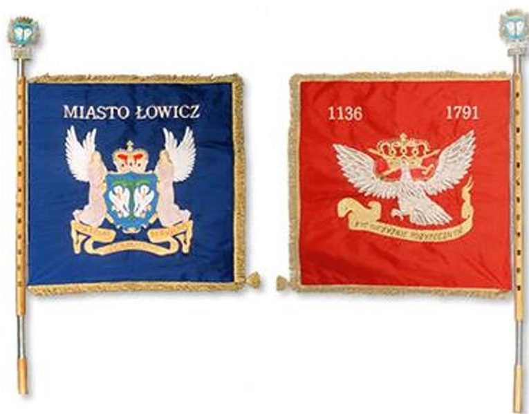
Rysunek 3. Chorągiew Miasta Łowicza.

srebrem, w tle głowy orła korona królewska zamknięta pięcioma fleuronami, zwieńczona jabłkiem i krzyżem kawalerskim polskim, poniżej korony regalia - berło królewskie i miecz, umieszczone na poduszce. Dziób i szpony orła oraz korona i regalia są złote. Pod orłem znajduje się wstęga z dewizą Miasta Łowicza o brzmieniu: Patriae Commodis Serviens, ze złotym liternictwem. Głowica Chorągwi składa się z tulei i zwieńczenia w postaci herbu Łowicza zwanego Herbem Małym w półwieńcu z coroną muralis, drzewce są dwudzielne, łączone tuleją z białego metalu na wysokości dolnego brzegu płata. Na górnym końcu drzewca osadzona jest głowica, na dolnym zaś stopka z białego metalu. Na drzewcu umieszczone zostały gwoździe pamiątkowe. Szarfa chorągwi o barwach Rzeczypospolitej zawiązana jest w kokardę umieszczoną poniżej głowicy na drzewcu, po głównej stronie płata. Jej obydwa wolne końce dochodzą do dolnego brzegu płata i obszyte są frędzlą złotą, taką jak płat chorągwi.