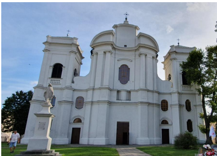
Fotografia 5. Widok na Kościół klasztorny pijarów pw. Najświętszej Marii Panny i św. Wojciecha.

Murowany, wzniesiony z cegły, tynkowany budynek kościoła, usytuowany na linii północ-południe, zwrócony jest prezbiterium na południe. Korpus kościoła, trójnawowy, bazylikowy (pseudobazylika typu jezuickiego), rozwiązany jest na planie prostokąta z wysuniętą absydą oraz z szerszą od korpusu monumentalną późnobarokową fasadą na planie falistym z rozstawionymi wieżami o rzucie kwadratu. Wejścia od północy - główne na osi nawy głównej, boczne nieznacznie przesunięte ku środkowi w stosunku do osi naw bocznych. Nawa główna szeroka, czteroprzęsłowa, przedłużona tej samej