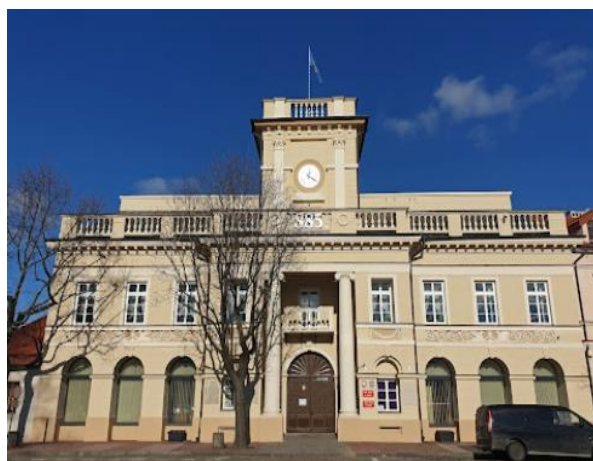
Fotografia 13. Widok na Urząd Miejski w Łowiczu.

Ratusz usytuowany jest kalenicowo w centralnej części północnej pierzei Starego Rynku. Budynek klasycystyczny, dwukondygnacyjny, częściowo podpiwniczony, dwutraktowy, z użytkowym poddaszem posiada dach dwuspadowy o kalenicy zaakcentowanej podłużną ścianką i z attyką tralkową, a na osi, nad bramą wieżę zakończoną attyką. Wzniesiony na rzucie prostokąta z ukośną zachodnią ścianą szczytową i wnęką na osi, w której umieszczona została brama przejazdowa. Brama przejazdowa sklepiona kolebką krzyżową z żaglem. Elewacja frontowa, o bogatej dekoracji, z wejściem - bramą na osi głównej w pozornym