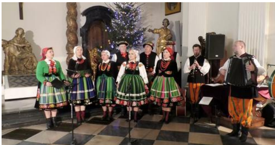
Fotografia 24. Zespół Śpiewaczy „Ksinzoki”.

Zespół Śpiewaczy „Ksinzoki” – powstał w grudniu 2010 r., a jego członkami są twórcy ludowi z Ziemi Łowickiej oraz pasjonaci kultury regionalnej. Zespół wykonuje pieśni księżackie, obrzędowe i religijne, w łowickiej gwarze. W pracy zespołu, ze szczególną uwagą traktuje się autentyczność, zarówno obyczajową, jak i językową.