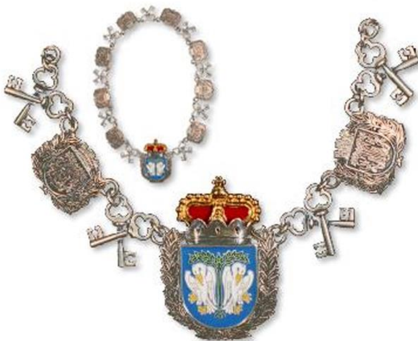
Rysunek 5. Łańcuch Burmistrza Miasta Łowicza.

Łańcuch Burmistrza wykonany jest z białego metalu, częściowo oksydowany. Składa się z ogniów w postaci stylizowanych kluczy Miasta, częściowo złożonych oraz herbu Miasta Łowicza zwanego Herbem Małym. Herb znajdujący się w połowie długości łańcucha, umieszczony jest w półwieńcu i zwieńczony mitrą książęcą. Herb pokryty jest emalią o stosownych barwach, mitra książęca jest złożona, a czapka mitry barwy czerwonej. Na prawo i lewo od herbu krytego emalią znajdują się po trzy mniejsze herby w półwieńcach zwieńczone coroną muralis, które są oksydowane.