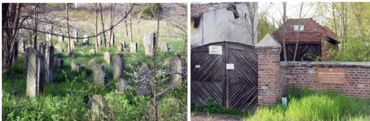
Fotografia 15. Widok na cmentarz żydowski oraz bramę wejściową cmentarza.

Cmentarz zajmuje działkę w kształcie nieregularnego wieloboku o powierzchni 1,8631 ha. Granice wyznacza ogrodzenie, w części południowej i wschodniej historyczne, ceglane, zaś w pozostałej partii współczesne, z płyt betonowych. Liczbę zachowanych pochówków określa się przybliżeniu na ok. 400. Są to nagrobki o różnej formie; steli, płyt nagrobnych, pomników otoczonych metalowym ogrodzeniem, obelisków. Najstarszy zachowany nagrobek pochodzi z 1831 r. Nie przetrwał pierwotny układ cmentarza, zatarte są ciągi komunikacyjne oraz podział na kwatery. Południowa część terenu jest zadrzewiona.