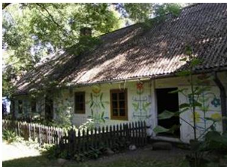
Fotografia 18. Skansen przy Muzeum w Łowiczu.

Poza skansenem w Łowiczu, funkcjonuje Łowicki Park Etnograficzny w Maurzycach, w ramach którego zgromadzono zabytki architektury z terenu dawnego Księstwa Łowickiego (obszar współczesnych powiatów łowickiego