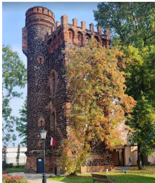
Fotografia 12. Widok na Basztę w Łowiczu (Źródło: https://www.google.pl/maps/ ).

Wieża murowana z cegły, kwadratowa z okrągłą wieżyczką wbudowaną w północno – zachodnie naroże. Obiekt o wysokości około 15 m. W ściany wmurowano kamienne elementy z łowickiego zamku prymasowskiego m.in. tablicę erekcyjną prymasa Jakuba Uchańskiego. Otwory okienne w każdej kondygnacji odmiennej wielkości i kształtu.