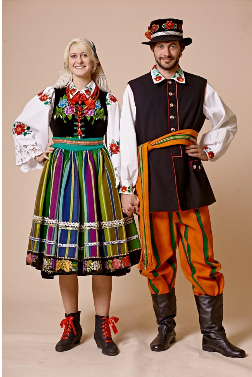
Fotografia 19. Strój łowicki.

zapaski zakładane na spódnicę, szyty zazwyczaj z czarnego aksamitu i zapinany na guziki stanik oraz mały kaftanik zwany spencerkiem. Na nogi zakładano wysokie trzewiki na obcasie sznurowane różnego koloru wełnianymi tasiemkami.