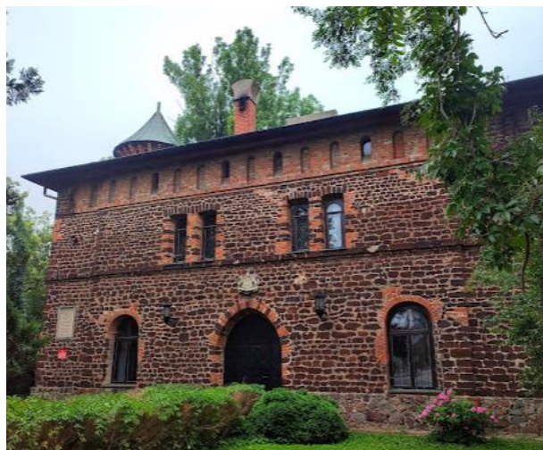
Fotografia 16. Widok na Pałac Klickiego.

Pałac dwukondygnacyjny, zbudowany na planie prostokąta, o dachu czterospadowym. Do krótszego boku budynku przylega okrągła wieża pełniąca pierwotnie funkcję klatki schodowej. Architektura pałacu określa faktura murów, wysunięte połacie i forma dachów.