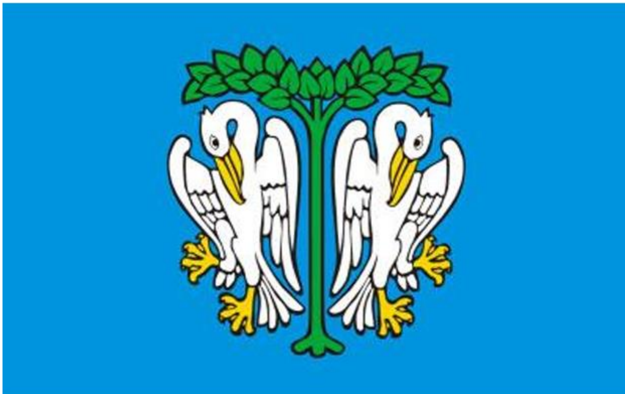
Rysunek 2. Flaga Miasta Łowicza.

Znaki Miasta Łowicza są symbolem tożsamości lokalnej społeczności. Jako zewnętrzne znaki reprezentacyjne jednostki samorządu terytorialnego, herb i flaga, stanowią jej własność i mogą być używane tylko w kształcie, proporcjach, kolorach w celach reprezentacyjnych i do oznaczenia własności samorządowej, zgodnych ze wzorami przyjętymi w drodze uchwały i Statucie Miasta Łowicza. Rada Miejska w Łowiczu Uchwałą Nr XXXII/295/2001 z dnia 24 maja 2001 roku ustaliła zasady używania i okoliczności używania Znaków Miasta Łowicza.