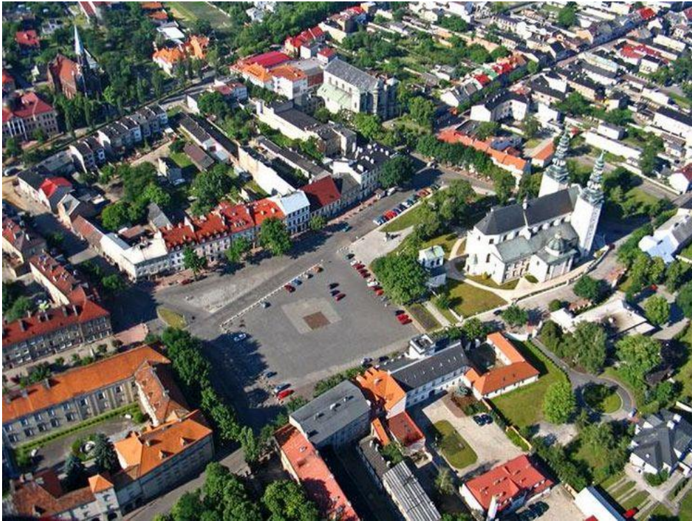
Fotografia 1. Widok na zabudowę Starego Rynku.