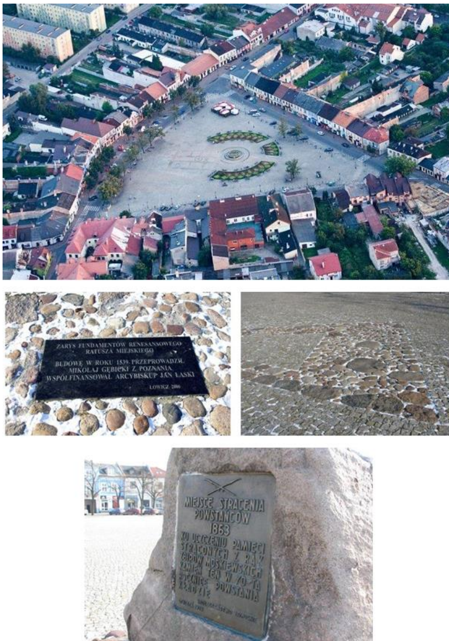
Fotografia 2. Widok na zabudowę Nowego Rynku (Źródło: http://www.kultura.lodz.pl ).