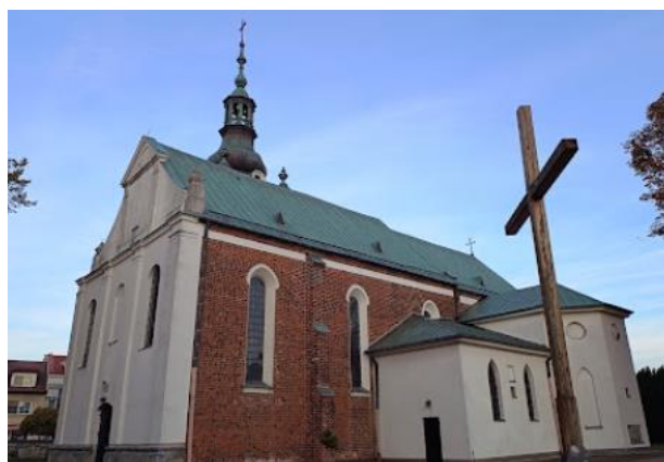
Fotografia 7. Widok na Kościół parafialny pw. Świętego Ducha.

Orientowany, jednonawowy, z węższym prezbiterium zamkniętym trójbocznie, murowany z cegły o układzie polskim. Od północy przy prezbiterium prostokątna przybudówka mieszcząca kruchtę i zakrystię w przyziemiu oraz skarbiec na piętrze. Także od północy do nawy dostawione dwie prostokątne kaplice - św. Trójcy i św. Walentego, między którymi usytuowana wieża na rzucie kwadratu, w której przyziemiu kruchta, na piętrze zaś dwa pomieszczenia. Od południa do prezbiterium dobudowano prostokątną kaplicę MB Różańcowej (zamkniętą apsydą półkolistą wewnątrz i trójboczną na zewnątrz), obok niej