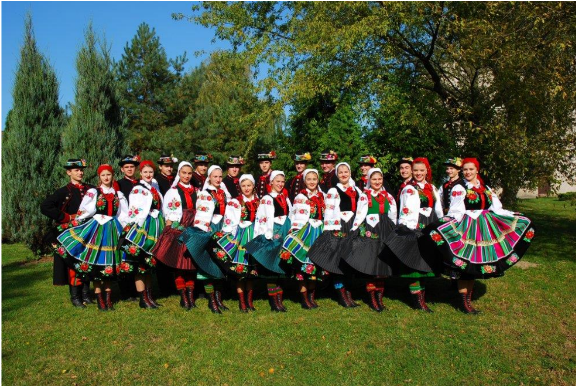
Fotografia 23. Zespół Pieśni i Tańca „Blichowiacy”.

Zespół Śpiewaczy „Ksinzoki” – powstał w grudniu 2010 r., a jego członkami są twórcy ludowi z Ziemi Łowickiej oraz pasjonaci kultury regionalnej. Zespół wykonuje pieśni księżackie, obrzędowe i religijne, w łowickiej gwarze. W pracy zespołu, ze szczególną uwagą traktuje się autentyczność, zarówno obyczajową, jak i językową.