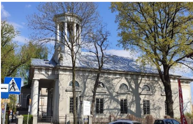
Fotografia 9. Widok na Dawny Kościół poewangelicki. (Źródło: https://www.google.pl/maps/ ).

Pierwszym ewangelikiem łowickim był kalwin Stanisław Murmelius, który za zgodą prymasa Jakuba Uchańskiego prowadził drukarnię w Łowiczu. Do upadku I Rzeczypospolitej wobec innowierców obowiązywał zakaz osiedlania się w mieście. Wraz z włączeniem miasta do zaboru pruskiego w Łowiczu zamieszkało pierwszych 15 ewangelików. Kolonie ewangelickie powstały również w okolicznych wioskach. Napływ dużej liczby wyznawców luteranizmu spowodował potrzebę zapewnienia domu wspólnej modlitwy.