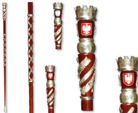
Rysunek 4. Laska Przewodniczącego Rady Miejskiej w Łowiczu.

Łańcuch Burmistrza wykonany jest z białego metalu, częściowo oksydowany. Składa się z ogniów w postaci stylizowanych kluczy Miasta, częściowo złożonych oraz herbu Miasta Łowicza zwanego Herbem Małym. Herb znajdujący się w połowie długości łańcucha, umieszczony jest w półwieńcu i zwieńczony mitrą książęcą. Herb pokryty jest emalią o stosownych barwach, mitra książęca jest złożona, a czapka mitry barwy czerwonej. Na prawo i lewo od herbu krytego emalią znajdują się po trzy mniejsze herby w półwieńcach zwieńczone coroną muralis, które są oksydowane.