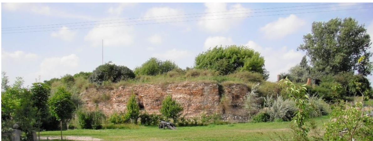
Fotografia 11. Widok na ruiny zamku prymasowskiego obecnie.

Obecnie obszar, gdzie znajdują się ruiny zamku stanowi własność prywatną, ale jest udostępniany zwiedzającym.