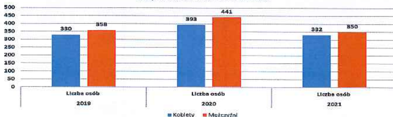
Liczba osób bezrobotnych w mieście Łowicz, zarejestrowanych w Powiatowym Urzędzie Pracy w Łowiczu w latach 2019 - 2021