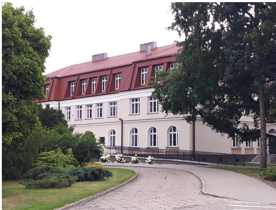
Budynek szkolny w zespole 6 – budynków przy ul. Blich 10 w Łowiczu