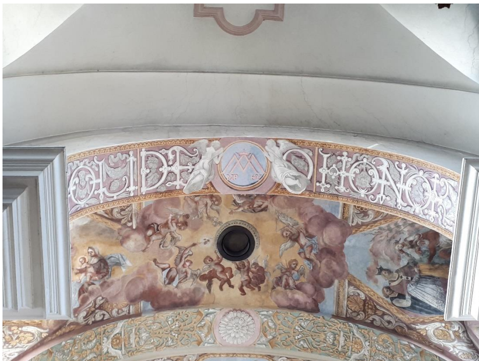
Odrestaurowane barkowe polichromie podłuczka w kościele oo. Pijarów pw. Matki Boskiej Łaskawej i św. Wojciecha w Łowiczu