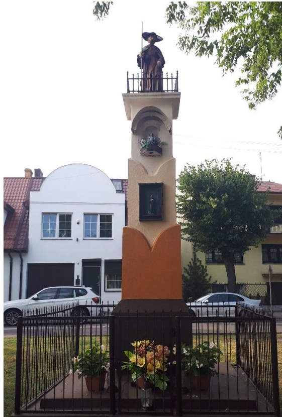
Odrestaurowana kapliczka przy parku Mickiewicza