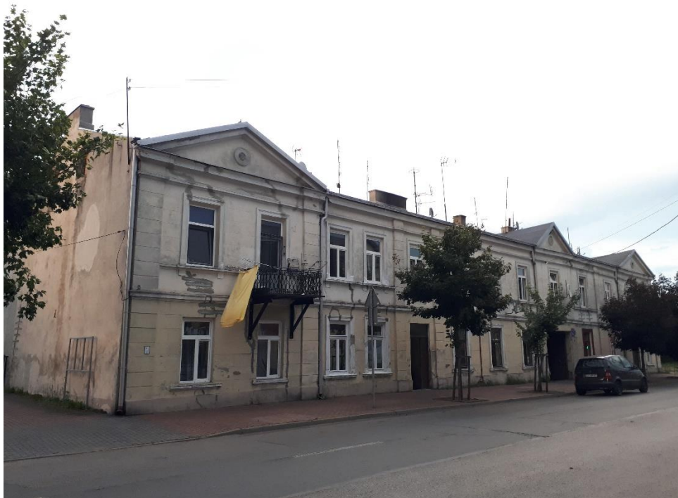
Dom przy ul. Świętojańskiej 2

W latach 2022 - 2023 ZGM w Łowiczu przeprowadził remont elewacji zewnętrznej budynku przy ul. Świętojańskiej 2 (fotografia poniżej). Wartość prac wyniosła 46 263,54 zł i została sfinansowana z budżetu miasta Łowicza.