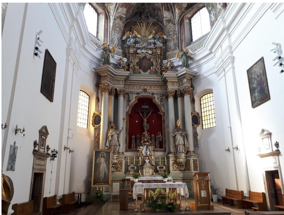
Odrestaurowane monochromatyczne ściany prezbiterium w kościele oo. Pijarów pw. Matki Boskiej Łaskawej i św. Wojciecha w Łowiczu