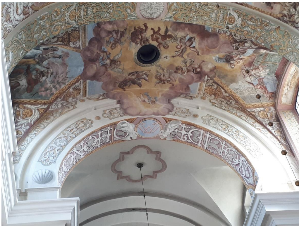
Łuk tęczowy od strony prezbiterium w kościele oo. Pijarów pw. Matki Boskiej Łaskawej i św. Wojciecha w Łowiczu

Również w 2022 r. wykonano konserwację estetyczną łuku tęczowego (fotografia poniżej). Koszt zadania wyniósł 99 872,43 zł, przy czym dotacja ze środków publicznych (Samorządu Województwa Łódzkiego) stanowiła 99 000,00 zł, a środki własne 872,43 zł.