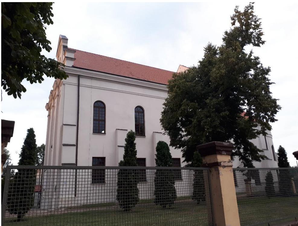
Dawny Kościół oo. Dominikanów w Łowiczu