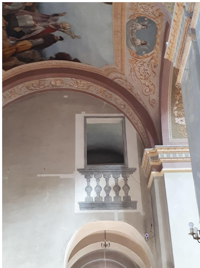
Odrestaurowane fragmenty dekoracji malarskiej nawy bocznej kościoła w kościele oo. Pijarów pw. Matki Boskiej Łaskawej i św. Wojciecha w Łowiczu