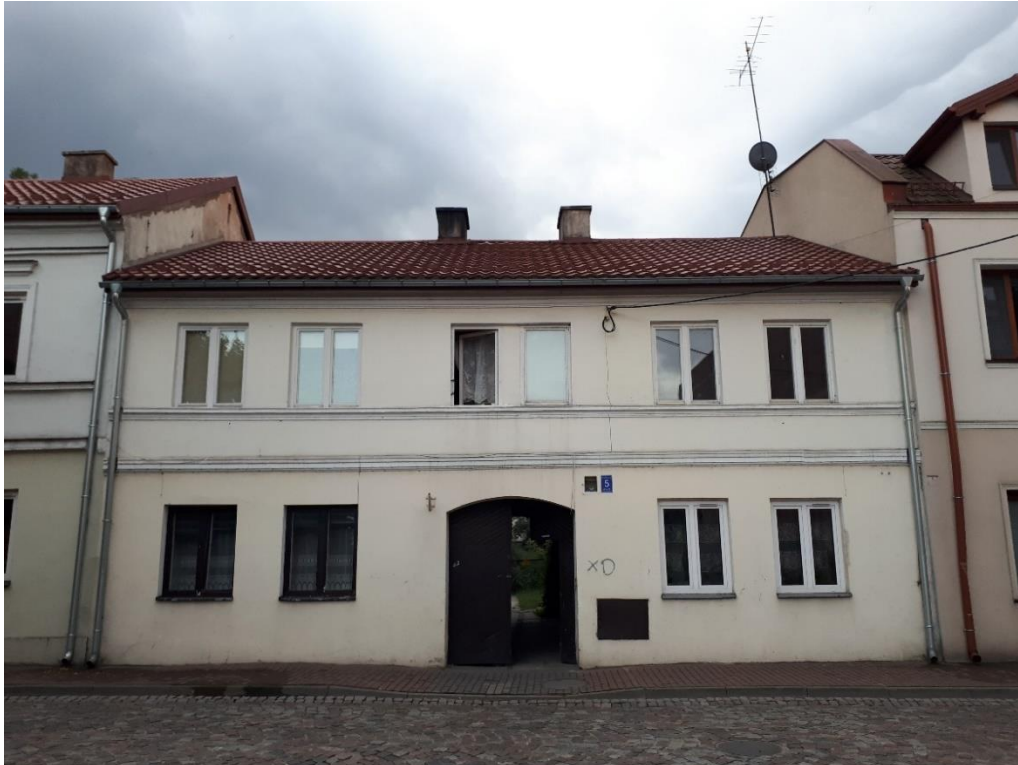
Dom przy ul. Podrzecznej 5