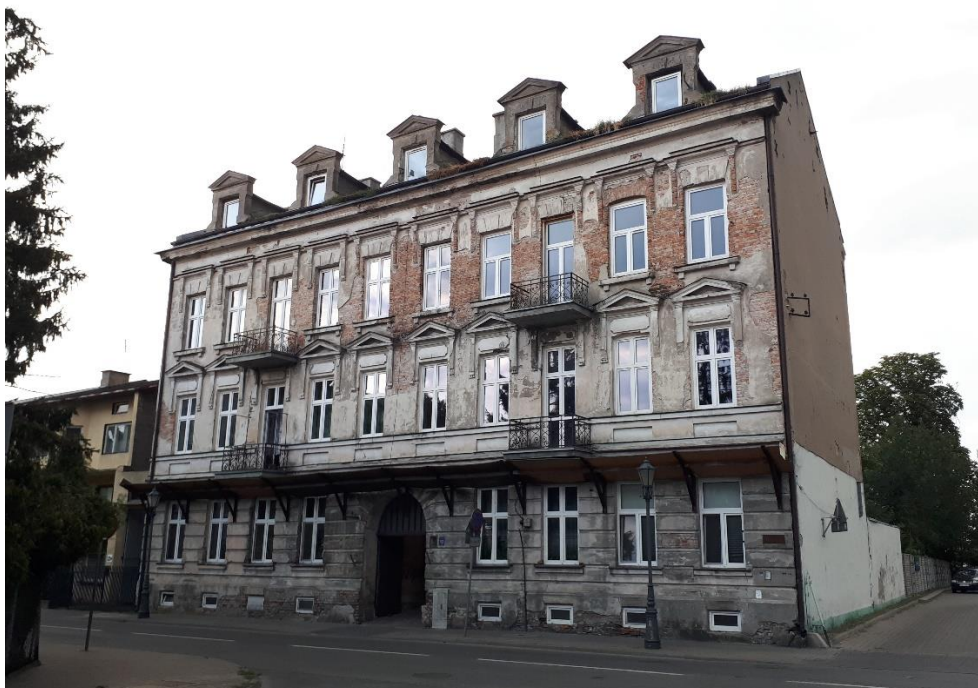
Dom przy ul. Tkaczew 13 w Łowiczu

W latach 2021 - 2022 ZGM w Łowiczu przeprowadził remont pokrycia dachowego na budynku przy ul. Tkaczew 13 (fotografia poniżej). Wartość prac wyniosła 29 990,49 zł i została sfinansowana z budżetu miasta Łowicza.