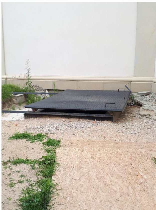
Wejście zewnętrzne do podziemi Katedry