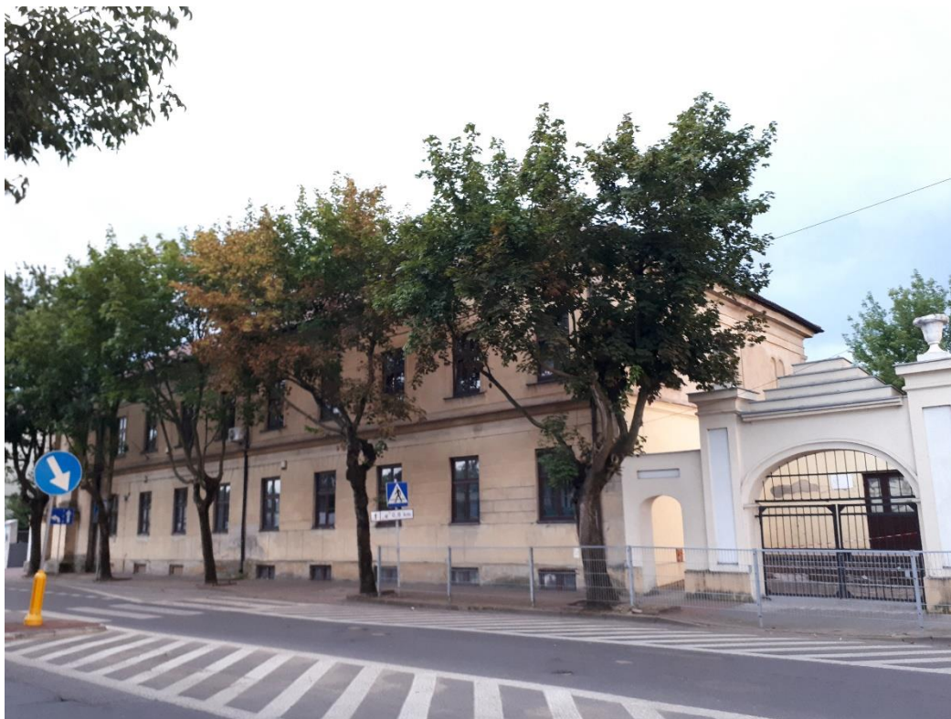
Dawny dom księży emerytów /budynek lewy/ przy ul. Świętojańskiej 1/3 w Łowiczu