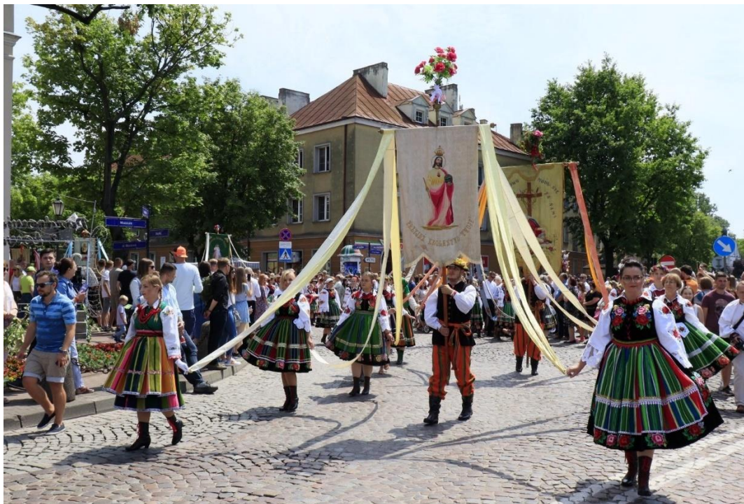
Procesja Bożego Ciała w Łowiczu

Procesję wzbogacają niesione chorągwie, sztandary i feretorny. Trasa procesji prowadzi ulicami miasta, wyruszając spod Bazyliki Katedralnej do czterech ołtarzy, przy których wierni zatrzymują się, by wysłuchać Słowa Bożego w kilku językach. W procesji uczestniczą przedstawiciele lokalnych władz samorządowych, liczni goście i turyści.