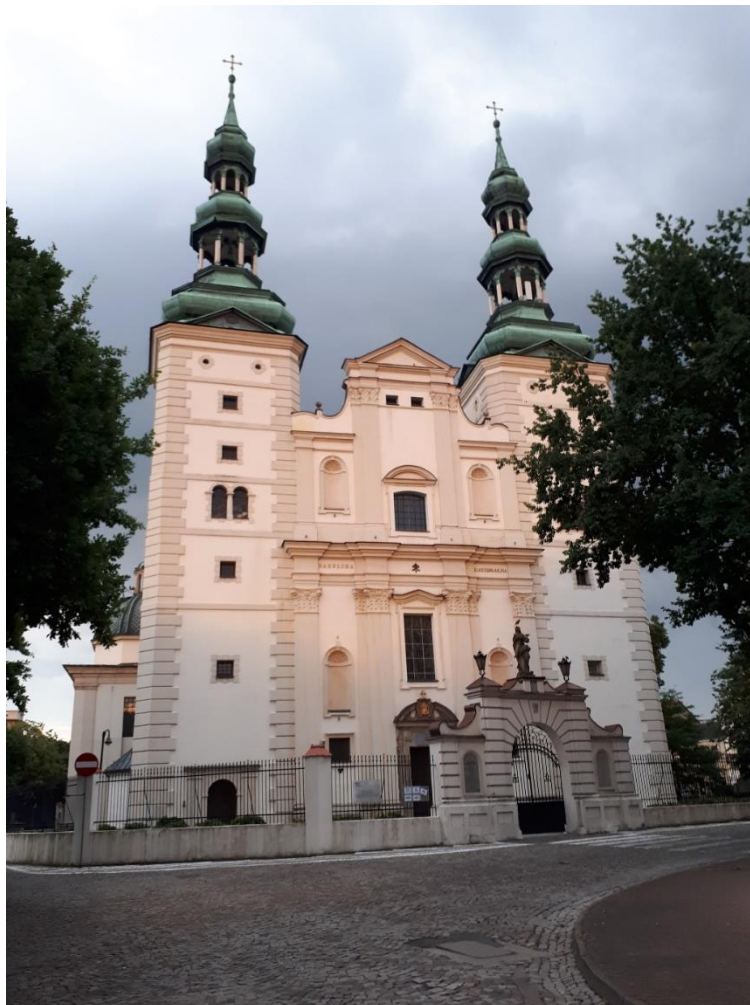
Bazylika Katedralna p.w. Wniebowzięcia N.M.P. i św. Mikołaja (d. Kolegiata) w Łowiczu

W 2023 r. rozpoczęto VI etap prac w podziemiach Katedry. Prace dotyczyły wykonania wejścia zewnętrznego do podziemi (fotografia poniżej), tj. wykonania prac archeologicznych, wykonania prac budowlanych, wykonania drenażu i odwodnienia. Koszt przeprowadzonych robót wyniósł 1 205 000,00 zł i został sfinansowany ze środków własnych.