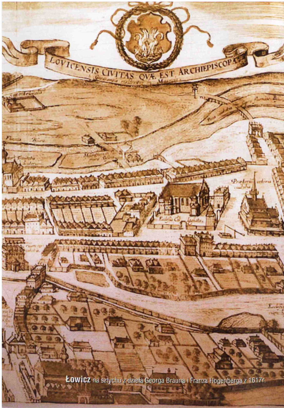
Łowicz na sztychu z dzieła Georga Brauna i Franza Hogenberga z 1617r.