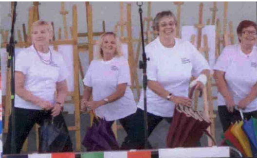
▲ Występ podczas Senioraliów 2012. ◀ Delegacja ŁUTW na Forum Ekonomicznym w Krynicy (2012). ▼ Przed pałacem w Montoire sur le Loir (Francja 2011).